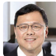
เคน เหลา กรรมการผู้จัดการจีนแผ่นดินใหญ่ และประธานเจ้าหน้าที่ฮ่องกง