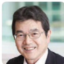
โนริโอะ โทโมโน ตัวแทนผู้อำนวยการ ประธานและ ประธานเจ้าหน้าที่บริหารประเทศญี่ปุ่น